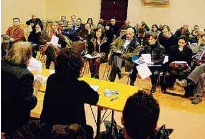
Un momento dell'assemblea

il lavoro malfatto da altri e fare cassa per pagare i servizi. Inoltre - continua De Vito - durante l'incontro gli amministratori non ci hanno mostrato nessun foglio di carta.