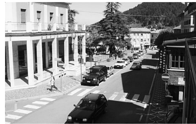
Uno scorcio del centro di Castelnuovo Monti