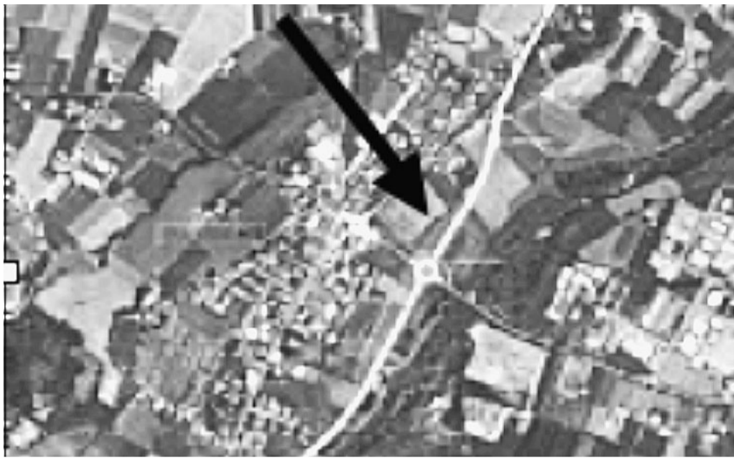
Il tracciato della variante di Puianello

Il consigliere d'opposizione prende anche posizione sull'insediamento commerciale "B9": «Propongo la can-