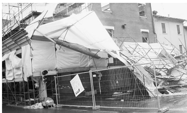
L'impalcatura crollata in centro a Roteglia

Prima la neve, poi l'acqua, poi il forte vento hanno messo a dura prova tutta la vallata del Secchia. Proprio il vento nella prima mattinata di ieri ha fatto cadere una intera impalcatura nel centro di Roteglia, che forse per fatalità o per l'orario, erano circa le 7.30, non ha causato danni alle persone. Nel piano inferiore si trova una macelleria. Sono stati danneggiati tuttavia solo due