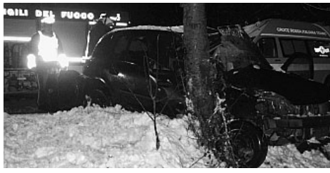
La vettura finita contro un albero

Tasso 5 volte sopra il limite Giovane ubriaco si schianta contro un albero: è grave