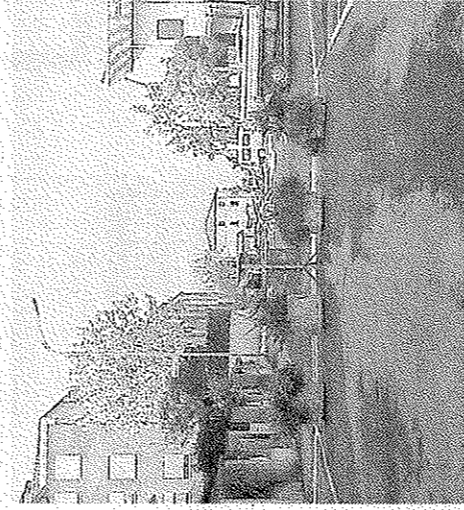
Un'eloquente immagine sullo stato del parco