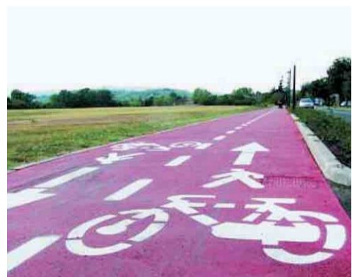
Un tratto della ciclopedonale che verrà inaugurata

Sarà inaugurato oggi il nuovo tratto di ciclopedonale che collega il centro di Albinea con Bellarosa. La pista - lunga 3 Km e mezzo - parte da Via Roncosano, e giunge all'inizio di Via Di Vittorio, all'incrocio con Via Matteotti, passando attraverso il Torrente Lavezza per mezzo di un ponte di 25 metri. Prossimamente il percorso sarà completato con la costruzione del tratto che su via Grandi costeggia il Circolo Tennis e lungo 200 metri. È dotata di pavimentazione bituminosa e di impianto di illuminazione. Appuntamento dunque alle 14.30 in Piazza Cavicchioni, dove saranno presenti stands di Auser e Tuttinbici; alle 15, partenza da Piazza Cavicchioni. Tappe: taglio del nastro all'imbocco del percorso su Via Di Vittorio