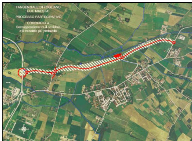
Fig.2 –Il Corridoio individuato dal Comune di Reggio Emilia nel maggio 2014.